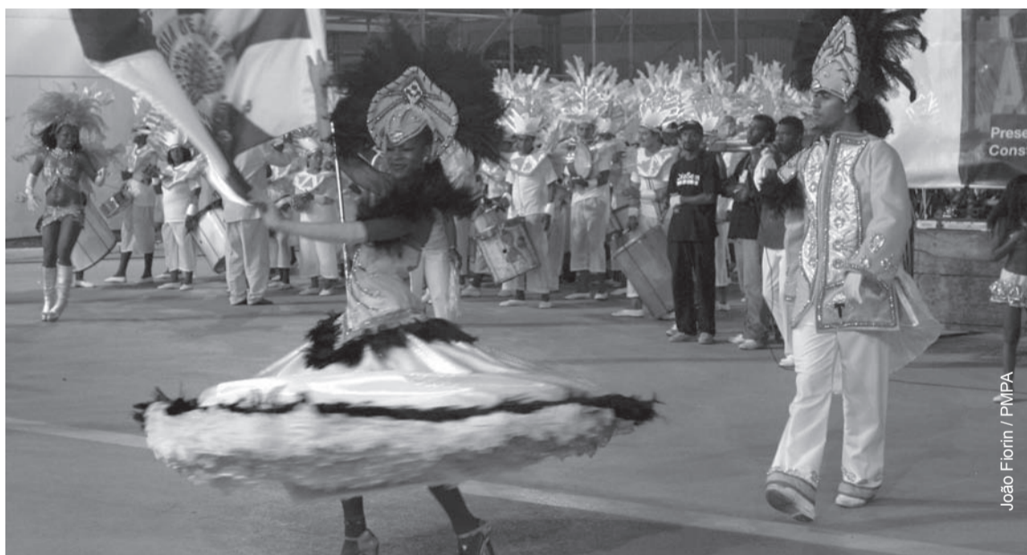
João Florin / PMPA

Sabem por quê? Porque a dança é uma atividade física e toda atividade física, quando bem praticada, libera em nosso organismo substâncias químicas que causam sensação de prazer. Vocês já devem ter aprendido isso nas aulas de Biologia, não? Depois de estudarmos dançando, vamos estudar fazendo teatro. E aí recomeçamos o ano!